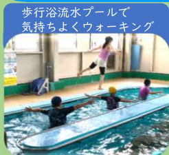
エンジョイウォーキング