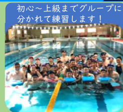
大人スイミング【火・金】