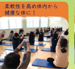
やさしいヨガ【水・金】