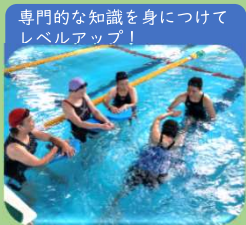
スイミー4種目泳法教室