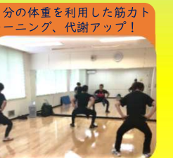
自重トレーニング