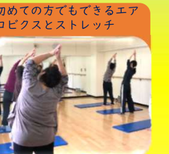
初級エアロビクス&ストレッチ