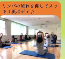
リンパストレッチ