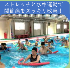
関節痛スッキリ改善予防