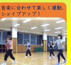
やさしいエアロ&ストレッチ